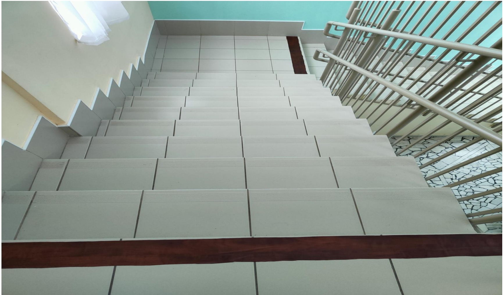
Φοτο № 16